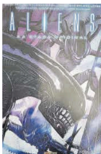
VARIOS AUTORES ALIENS. LA ETAPA ORIGINAL 3 Panini

Penúltimo volumen donde se nos recopila cronológicamente todas las historias de esta franquicia previas a la actual adquisición de los derechos por parte de Marvel. Más de treinta años editados por Dark Horse en EEUU, en unos majestuosos y voluminosos libros de casi mil páginas, nos muestran toda una suerte de historias y, por supuesto, autores muy interesantes. En el presente podemos encontrar historias realizadas por nombres de primera fila internacional como Richard Corben, Moebius, Eduardo Risso, Francisco Solano López o Bernie Wrightson. Sería imposible reseñar la totalidad de manos que concurren a la hora de mostrar tantos relatos de nuestros xenomorfos favoritos. Como los aliens solo se mueven por instinto primario, poco más pueden aportar como novedad; lo verdaderamente interesante son todas aquellas historias de los humanos que por allí van pasando, cargadas de emociones, necesidades e intereses, verdadero motor de un relato bien estructurado y con el suficiente cuerpo para hacer vibrar al lector. Como siempre, la sombra de la corporación Weyland-Yutani, que pretende quedarse con la explotación de estos organismos, es muy alargada y omnipresente, con tal falta de ética que no le importa el coste humano para conseguir su fin. Como detalle y gran acierto, la creación del personaje Mondo, un soldado de fortuna, bravucón y socarrón, en historias no exentas de mala leche y mucho humor. Última que solo hicieran un par de relatos, aun así, fabulosos. ■