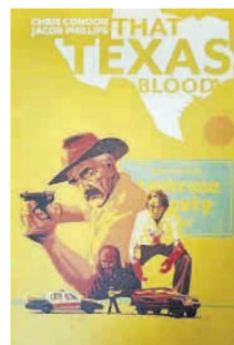
CHRIS CONDON Y JACOB PHILLIPS THAT TEXAS BLOOD Planeta Cómics

Genuino género negro con mayúsculas. No puedo decir otra cosa que halague más a esta serie o a sus magníficos creadores. Como si de una serie televisiva de género se tratara, con un ritmo pausado, donde los momentos de tranquilidad, mundanos e, incluso, hogareños tienen tanto peso, si no más, que la propia historia criminal. Es una historia coral que se va desgranando pedazo a pedazo mientras vamos conociendo a los actores en este escenario: un pequeño pueblo de Texas donde, al parecer, todos guardan secretos y lo más insospechado puede ocurrir a la vuelta de la esquina. El eje central es el sheriff, un tipo septuagenario que, aún, sigue en su cargo por aquello de alargar la cantidad a cobrar en las complejas pensiones americanas. Aquí los misterios no lo son tanto y, si lo son, toda una suerte de sentimientos, buenos y malos, que motivan los actos de los personajes, principal motor del relato. Con algunos subargumentos que quedan entre bambalinas, la historia central es cerrada, por lo que no tenemos que esperar hasta el próximo. Condon ha creado su historia más personal mientras sigue colaborando con Marvel o DC. Por su parte, el trabajo gráfico del hijo de Sean Phillips es magnífico, como nos tiene acostumbrados, y, creo, uno de los mejores artistas a la hora de recrear los tintes del género criminal. Una de las series más sobresalientes y recomendables de la temporada. ■