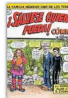
'¡SÁLVASE QUIEN PUEDA!' ROBERT CRUMB Y ALINE KOMINSKY 42 páginas - 11,50 euros. La Cúpula

Una posibilidad tan hilarante como que fueran los hombres en vez de las mujeres quienes sufrieran la menstruación todos los meses da lugar a una serie de situaciones de ironía mordazmente crítica. Breves episodios demuestran las hipotéticas repercusiones sociales, políticas, históricas o religiosas, en las cuales se volvería a producir el mismo desequilibrio de poder contra el género femenino pero basado en diferentes prejuicios. En el Oeste, el Medioevo, la prehistoria, el rock, la guerra, la moda o el psicoanálisis, la regla pasaría a ser un símbolo de virilidad cuanto más abundante y dolorosa fuera.