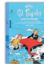
'GIL PUPILA' MAURICE TILLIEUX 224 páginas. 37,95 euros. Dolmen.

Un oscuro y terrible misterio flota sobre la aventura de un investigador aficionado que se involucra en la inexplicable desaparición de un antiguo sarcófago. Como evocador escenario, el París de 1900, poblado por una serie de pintorescos elementos y personajes: ciencia y esoterismo, científicos y policías, museos y catacumbas, rufianes y dandis de sexualidad incierta. La presencia del color, casi pictórico, aporta un componente expresionista muy envolvente que ambienta con propiedad este caso de tintes folletinescos cuyo elegante protagonista debe afrontar peligros sin cuento mientras averigua la identidad de un insólito criminal.