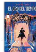
'EL ORO DEL TIEMPO' RODOLPHE Y ORIOL 168 páginas. 38 euros. Norma.

serie ya de culto que lleva construyendo con mimo desde 1995. El tapiz de personajes que ha entretejido desde entonces durante más de 80 números ha venido siendo recopilado por La Cúpula en sucesivos volúmenes, de los que ahora se publica la tercera parte de 'Sunshine & Roses'. Sus marginales personajes son zaranreados por el destino como las balas perdidas del título, a veces erráticos y a menudo marcados por la muerte. Para finalizar, un clásico del género detectivesco que recobra actualidad tras el inicio de su recopilación en volúmenes integrales desde el primer álbum. Creado en 1956 por Maurice Tillieux, 'Gil Pupila' es un investigador que afronta todo tipo de enigmas para resolver sus casos. Lo hace secundado por una serie de pintorescos y divertidos personajes, con un dibujo semirrealista de línea clara muy legible y atractivo. El libro contiene numerosos extras que comprenden portadas, ilustraciones y artículos inéditos.