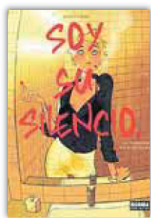
'SOY SU SILENCIO' JORDI LAFEBRE 112 páginas. 25 euros. Norma.

Una psiquiatra está, paradójicamente, siendo evaluada por un colega suyo tras haberse visto envuelta en el asesinato de un acaudalado viticultor. La muchacha es inteligente, atractiva e irónica, por lo que su relato de los hechos es esclarecedor pero repleto de enigmas. El tono desenfadado enmascara dramas y variadas experiencias traumáticas, pero describe la reunión familiar de los Monturós en su lujosa finca para que la matriarca del clan haga lectura de su testamento en vida. Con un grafismo suave y elegante, Lafebre transcribe los razonamientos de esta joven que conversa con sus propios difuntos.